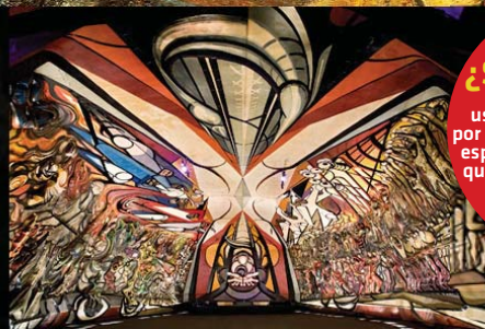
La Marcha de la Humanidad (Polyforum Siqueiros)

1964 Comenzó a pintar su mural "La Marcha de la Humanidad". Actualmente está en el Polyforum Cultural Siqueiros.