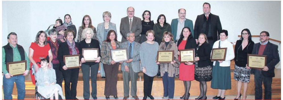
El trabajo asistencial fue reconocido en Ciudad Juárez, donde seis instituciones y dos personas recibieron un premio en el Día Estatal de la Filantropía