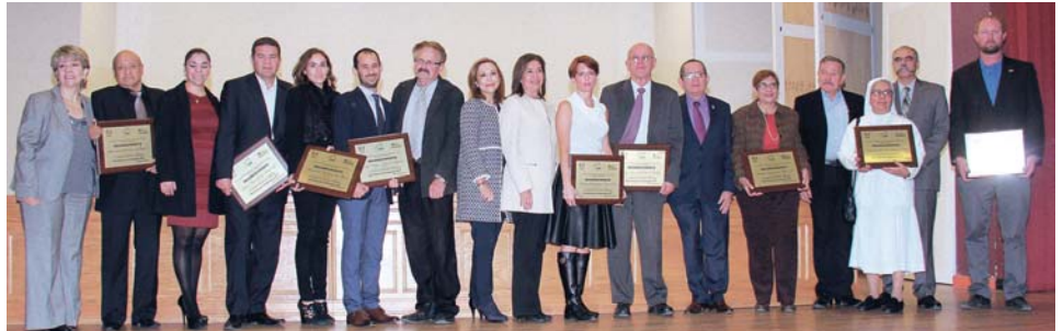
La ciudad de Chihuahua se vistió de gala para enaltecer la entrega de personas e instituciones que buscan mejorar la calidad de vida de 500 mil chihuahuenses, que viven en pobreza

“Al realizar esta premiación, queremos que se sepan las buenas noticias para que contagien a otros; queremos impulsar la cultura del ayudar y fortalecer el trabajo de las organizaciones de la sociedad civil”.