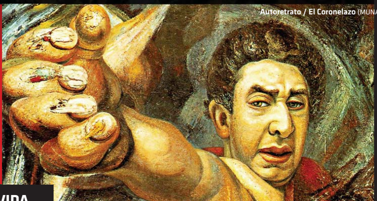
Autoretrato / El Coronelazo (MUNAL)

*Según recientes investigaciones, se cree que en realidad nació en la Ciudad de México