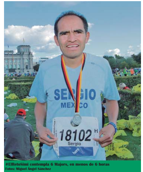
#ElRetoSimi contempla 6 Majors, en menos de 6 horas

Desde entonces, el récord varonil en esta maratón ha