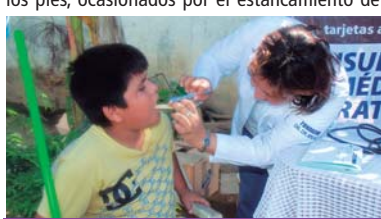
Cuidado especial a menores