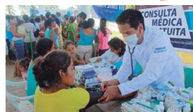
Ayuda médica gratuita

Además, en tan solo tres días, los médicos de la Fundación del Dr. Simi en coordinación con los de Fundación Best, lograron realizar cerca de 300 consultas gratuitas. Los principales padecimientos que atendieron fueron infecciones por hongos en los pies, ocasionados por el estancamiento de