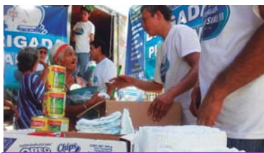
Atención a la tercera edad

Una vez más quedó demostrada la solidaridad del Dr. Simi, ya que, en un mes, entregó más de 100 toneladas de ayuda en siete estados de la república, para beneficiar a cerca de 50 mil personas.