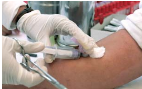
Los recursos para apoyar el VIH/sida se han estancado

“En el contexto de la crisis financiera mundial el informe destaca lo urgente que es seguir movilizando el apoyo de los países, los donantes y los organismos mundiales, con el fin de responder a la epidemia del VIH”, subrayó el informe.