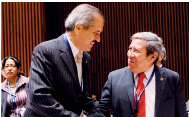
Para presidir la OPS se redoblarán esfuerzos

México fue electo para presidir durante el próximo año la Presidencia del Consejo Directivo de la Organización Panamericana de la Salud (OPS).