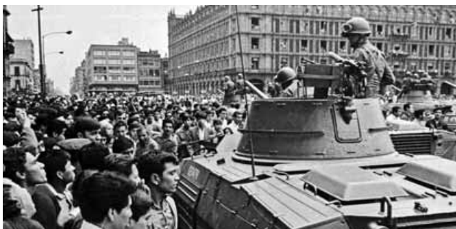
Después de 42 años los recuerdos continúan