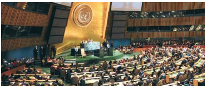
La ONU busca la solidaridad en tiempos difíciles

El presidente de la 65 Asamblea General de la ONU fue el diplomático suizo Joseph Deiss, quien moderó las participaciones de mandatarios como el estadounidense Barack Obama, el iraní Mahmoud Ahmadineyad y el boliviano Evo Morales.