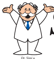
Dr. Simi ®