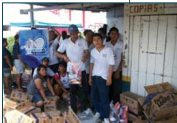
La Fundación del Dr. Simi llevó víveres a comunidades afectadas por el huracán Dolly en Tamaulipas