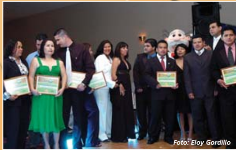
Empleados de Farmacias Similares recibieron un reconocimiento por su trabajo

y Chile; los mejores vendedores del segundo trimestre de este 2008, que recibieron el máximo galardón que otorga Farmacias Similares a sus colaboradores: el Dr. Simi de oro y el de plata.