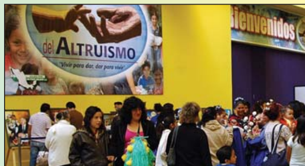
La Fundación del Dr. Simi lanzó la convocatoria para los premios Unidos Para Ayudar y Por Un País Mejor

De acuerdo con la directora de la séptima fundación más importante de México, los candidatos serán valorados por un jurado estatal conformado por personajes de recono-