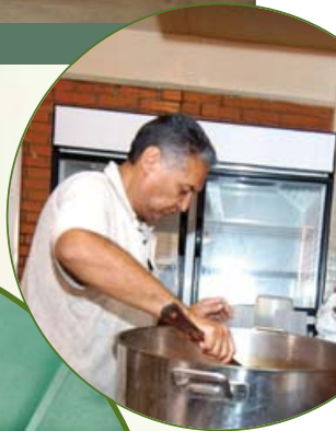
El Dr. Simi cuenta con Un Amigo Más para dar apoyo a jóvenes en recuperación