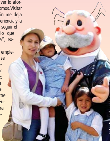
Fundación Niños de Eugenia recibió la visita del Dr. Simi